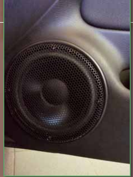
Wie der Breitbänder erhielt der Andrian-Audio-16er ein selbst gefertigtes Gitter

Kompliment machen, dass er sich perfekt einfügt. Er ist nie als von hinten kommend ortbar und legt ein stimmiges Fundament unter die Musik. Das ist ein sehr gelungenes Auto.