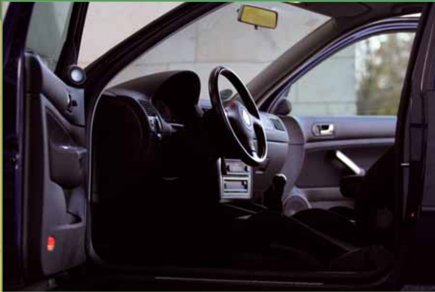
Bis auf die dezenteren Lautsprecheraufnahmen blieb der Innenraum optisch original