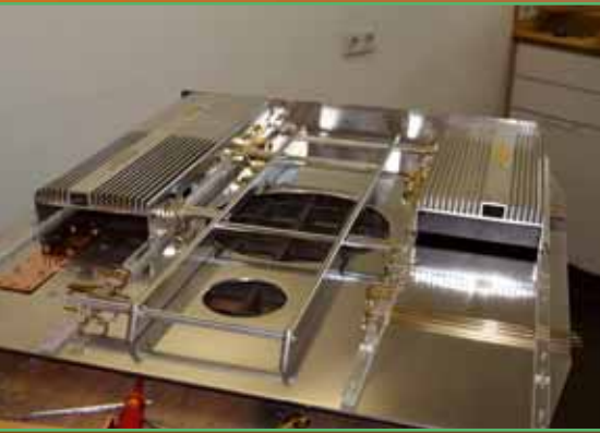
Kabelfrei: Im Kofferraumausbau regieren massive Stromschienen