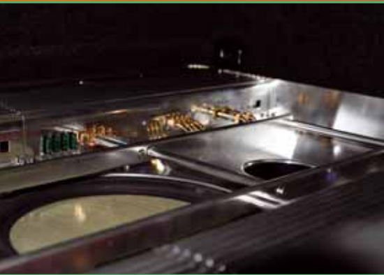
Fertig bestückt mit Ali und Genesis-Stufen ist der Kofferraumeinsatz eine Augenweide