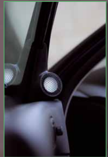
Der 50-mm-Breitbänder passt prima ins Spiegeldreieck