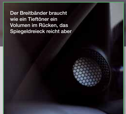
Der Breitbänder braucht wie ein Tieftöner ein Volumen im Rücken, das Spiegeldreieck reicht aber