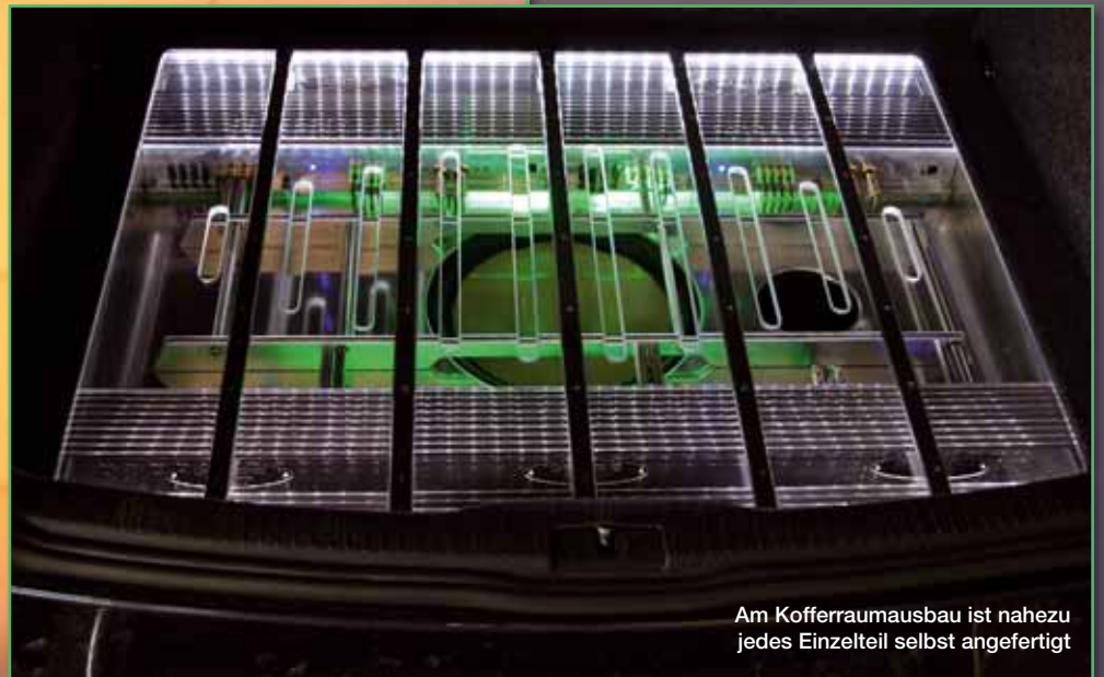
Am Kofferraumausbau ist nahezu jedes Einzelteil selbst angefertigt