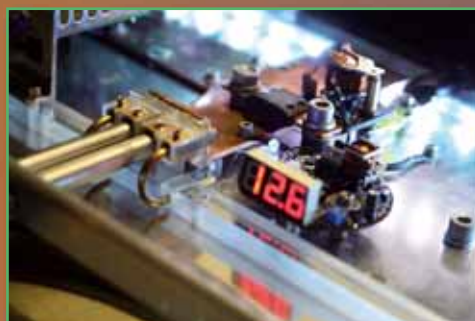
Absicherung, Relais und Spannungsanzeige sind selbstverständlich Marke Eigenbau

Es wurde eine langer Abend mit Hörsession, bei der wir uns live und in Farbe von den Highlights des Einbaus und dem mal richtig gut gelungenen Sound überzeugen konnten. Die Spezialität des Breitbänder-Frontsystems liegt erwartungsgemäß in der räumlichen Abbildung, die präzise und harmonisch gelingt. Felsenfeste Bühne nennt man sowas und es macht jede Menge Spaß zu hören. Der Sound kommt so harmonisch ans Ohr, dass er sofort als richtig identifiziert wird. Der Zwe Zoll-Breitbänder hält sich zwar ganz obenrum mit der Auflösung zurück, aber das stört wie gesagt niemanden. Die Unterstützung im Kickbassbereich tut ihres zum anspringenden Sound – Dynamik bis zum Abwinken, zumal das Timing stimmt! Bassdrums und abrupte Einsätze zeigen, dass in diesem Golf viel richtig gemacht wurde bei Einbau und Einstellung. Dem Subwoofer kann man das