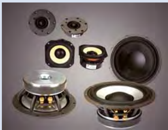
Die Lautsprecher der DLS Scandinavia Line feierten unter Federführung der AIV am 5.9. Deutschlandpremiere