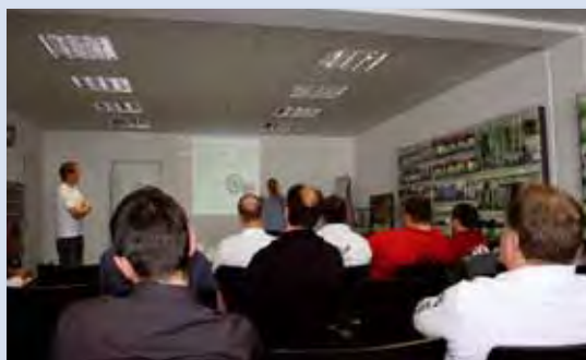
AIV veranstaltete Workshops und Führungen