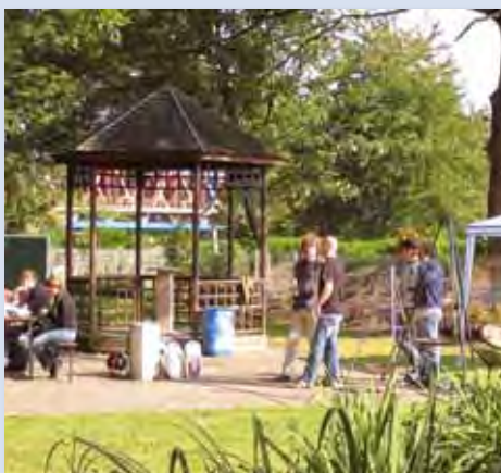
Das Finale 2008 fand guten Anklang, wir freuen uns schon auf eine gelungenen Wiederholung