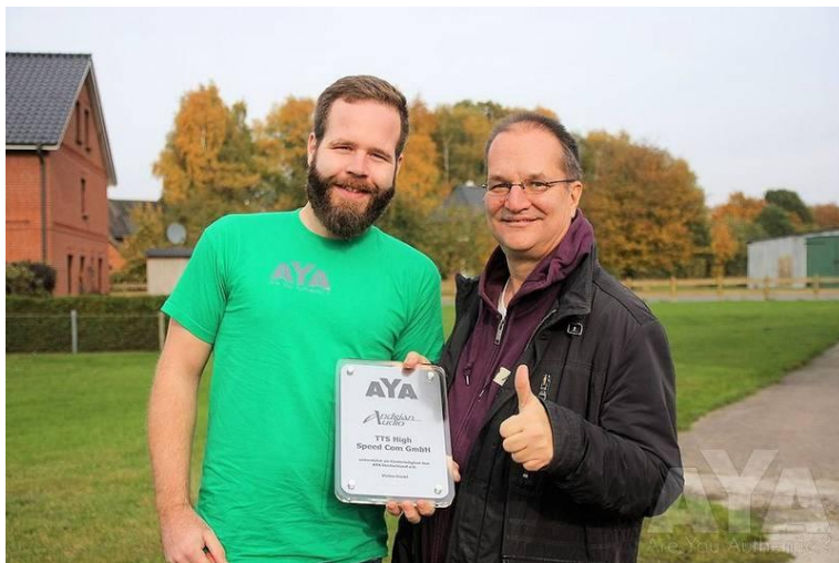
Jährlich neue, hochwertige Dankestafeln für unsere Fördermitglieder