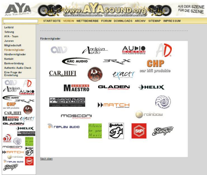
Die AYA-Homepage mit Nennung und Verlinkung der Fördermitglieder