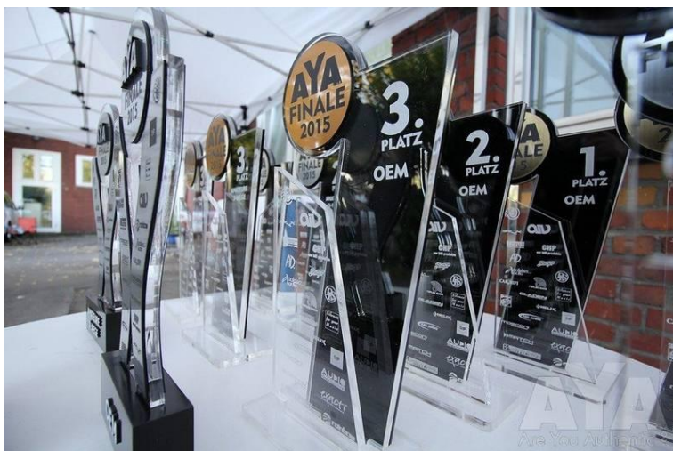
Finalpokale mit Logos unserer Fördermitglieder