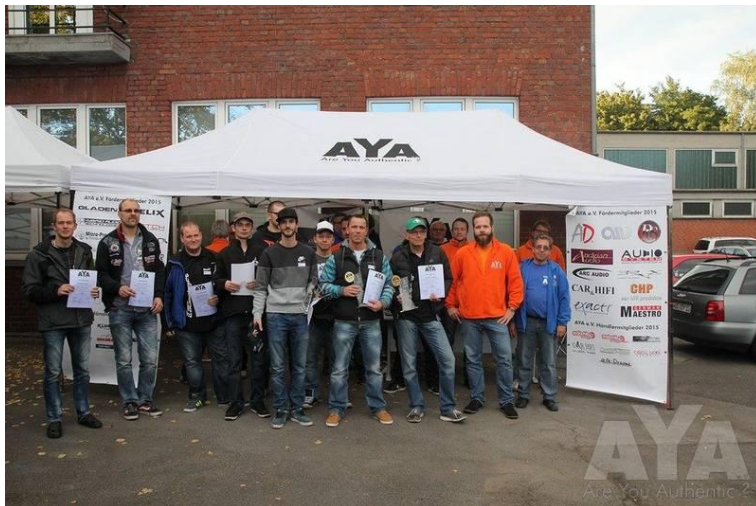
Ihr Markenlogo auf jeder Veranstaltung auf unseren AYA-Zelten