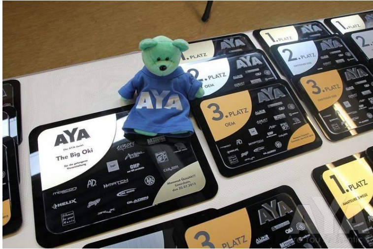
Wettbewerbsplaketten mit den Logos unserer Fördermitglieder