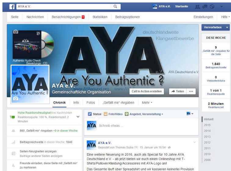
Facebook mit über 800 Followern und hoher Beitragsreichweite