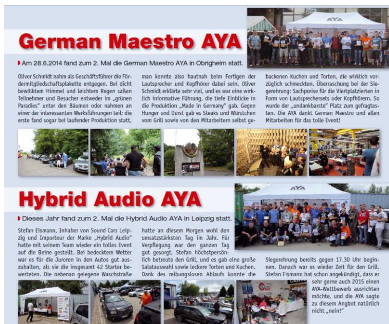
Regelmäßige Eventberichte in Fachzeitschriften